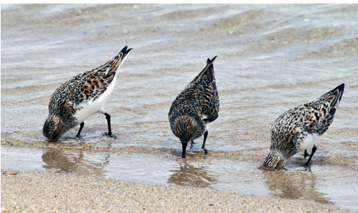
Figure 2 : Habitats et espèces visées par les 2 directives de l'Union européenne : banc de maërl, omphalode du littoral sur une dune, bécasseaux sanderling sur estran.