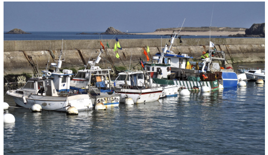
Figure 3 : Usages (PB).

qu'un diagnostic socio-économique. Il définira des objectifs de gestion à court, moyen et long terme et les actions à mettre en œuvre pour y répondre. L'ensemble de ces étapes sera jalonné de nombreux moments d'échanges informels et formels dans le cadre de réunions d'information, du comité technique, de groupes de travail, du comité de pilotage. Le diagnostic écologique axé sur les espèces et les habitats des deux directives (fig. 2) intégrera aussi les autres espèces de faune et de flore patrimoniales ainsi qu'un diagnostic paysager et archéologique. L'objectif d'une telle démarche est de formaliser une connaissance globale des deux îles, des îlots et du domaine maritime dans une optique de gestion intégrée du territoire.