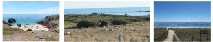
Pique-nique à Porz Chudel à Houat, Landes de Bretagne à Hoedic et Plaisance sur la grande plage - Treac'h er Goured, Houat, A. Auriere.