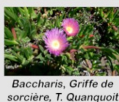
Baccharis, Griffes de sorcière, T. Quanquoit